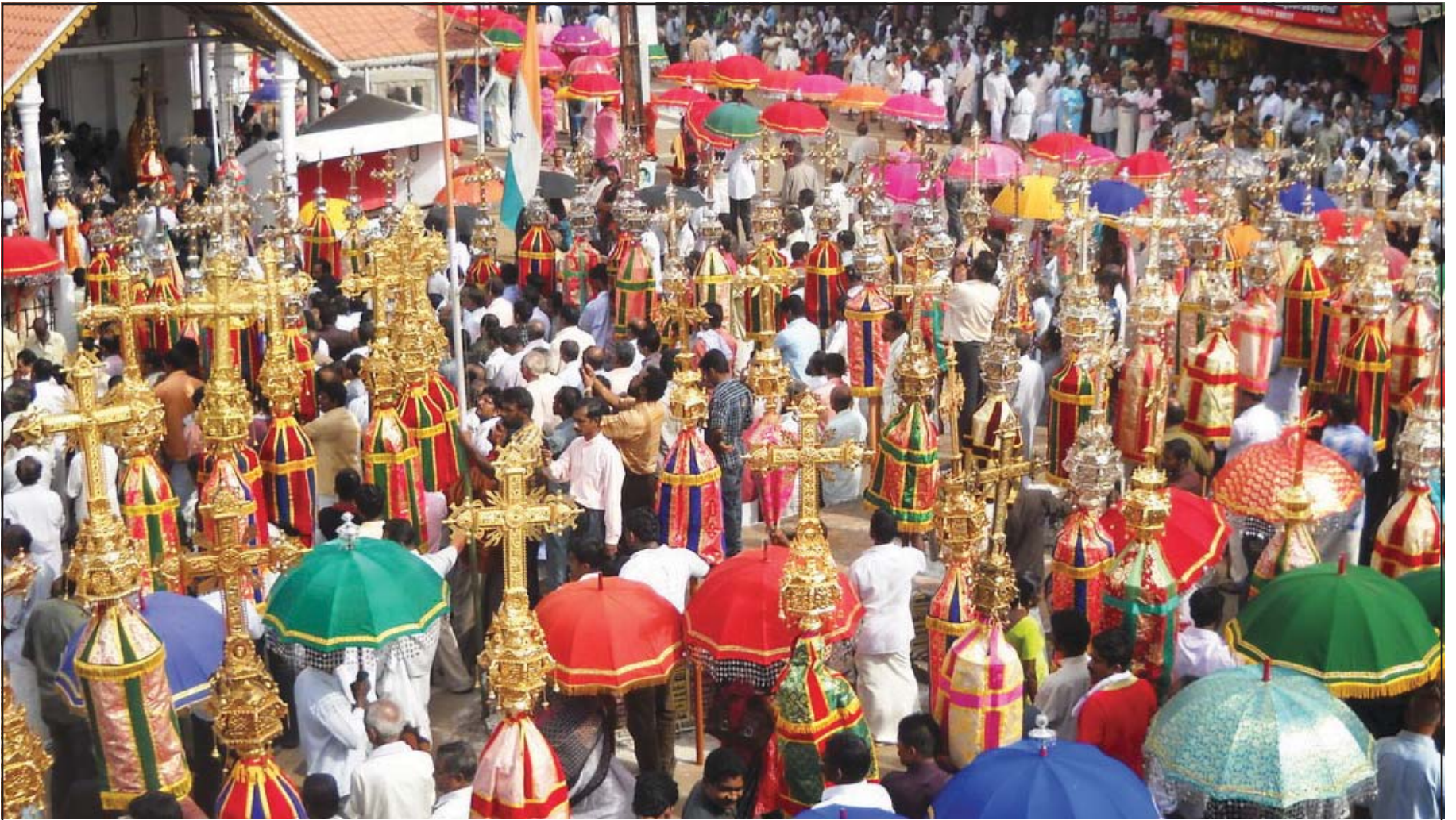
എട്ടുനോമ്പ് പെരുന്നാളിനോടനുബന്ധിച്ചുള്ള പ്രദീക്ഷണം മണർകാട് കവലയിലുള്ള കുരിശുപള്ളിയിൽ എത്തിച്ചേർന്നപ്പോൾ

Web: www.stmarysyouthmanarcad.org www.syrinchurch.org/Kolosuryoyo.htm (internet edition)