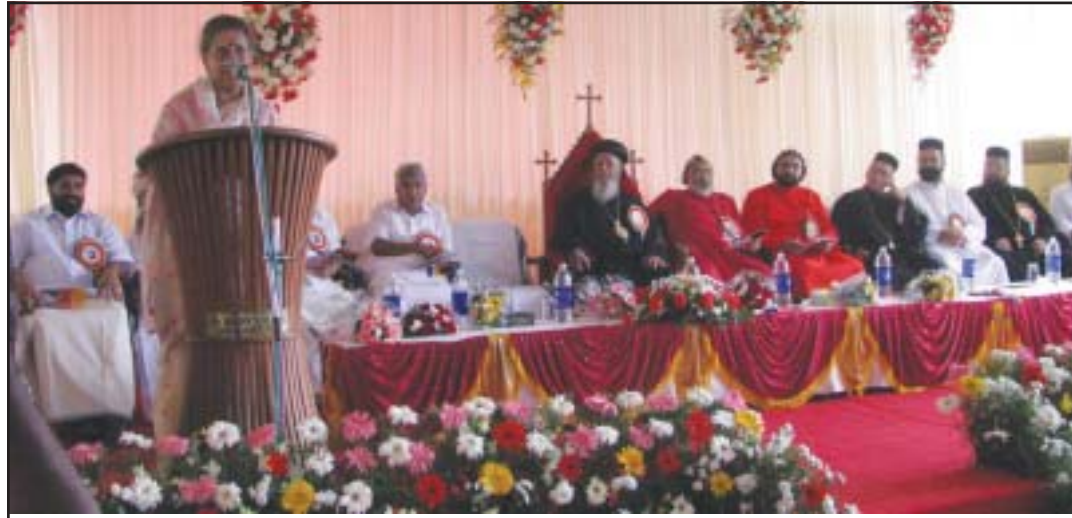
പെരുന്നാളിനോടനുബന്ധിച്ച് നടന്ന സമ്മേളനത്തിൽ കേന്ദ്രവാർത്താവിതരണ പ്രക്ഷേപണവകുപ്പ് മന്ത്രി ശ്രീമതി അംബികാ സോണി മുഖ്യപ്രഭാഷണം നടത്തുന്നു.