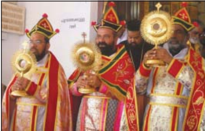
എട്ടുനോമ്പ് പെരുന്നാളിനോടനുബന്ധിച്ചുള്ള റാസ വി. മർത്തമറിയം കത്തീഡ്രലിൽനിന്നും പുറപ്പെടുന്നു