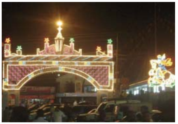
ദീപാലംകൃതമായ മണർകാട് പള്ളിയുടെ വിവിധ ദൃശ്യങ്ങൾ