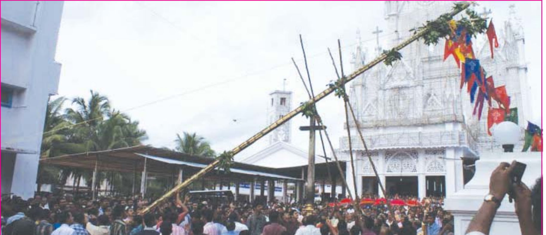
മണർകാട് പള്ളി എട്ടുനോമ്പ് പെരുന്നാളിന് തുടക്കം കുറിച്ചുകൊണ്ട് കൊടിമരം ഉയർത്തുന്നു