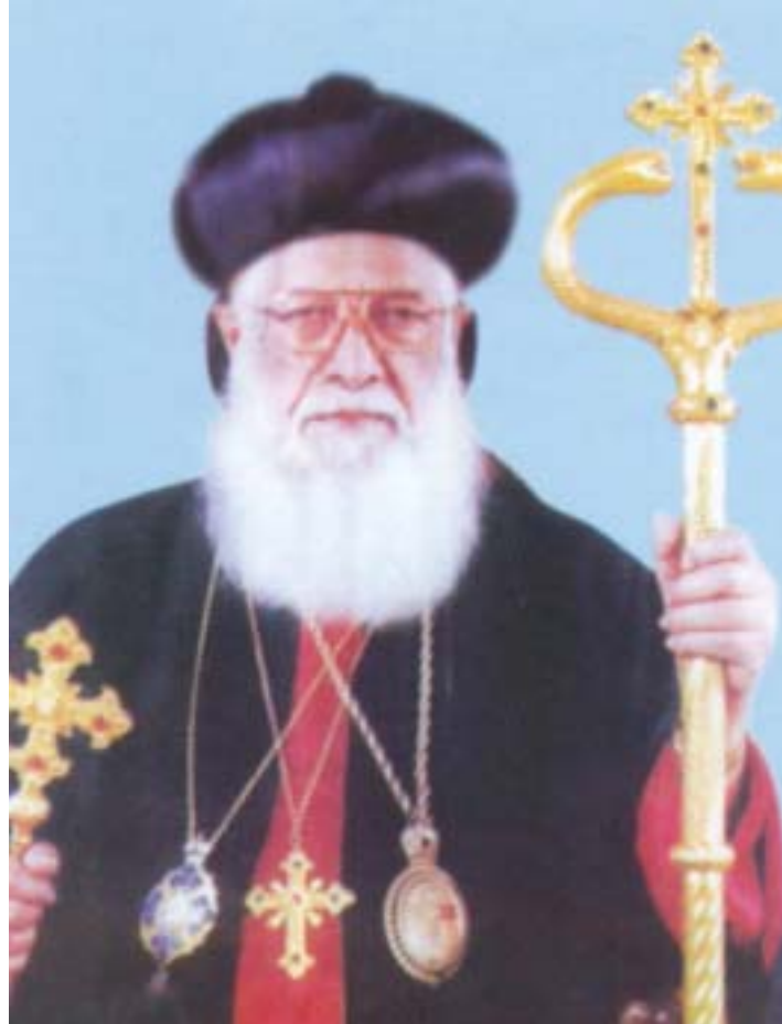
ശ്രേഷ്ഠ ബസേലിയോസ് പൗലൂസ് ദ്വിതിയൻ ബാവ സെപ്തംബർ 1