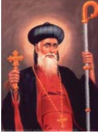
വിശുദ്ധ പൗലൂസ് മോർ കുറിലോസ്