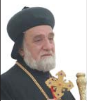
അഭിവന്ദ്യ മോർ യൂലിയോസ് യേശു ശീശക് ഒക്ടോബർ 29