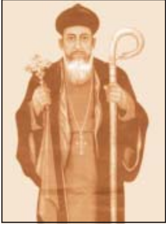
വിശുദ്ധ ശ്രെങ്കളാ മോർ ബസ്സേലിയോസ് മൂപ്പിയാന