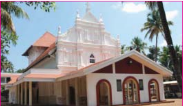
കത്തീഡ്രലായി ഉയർത്തിയ അങ്കമാലി മർത്തമറിയം യാക്കോബായ സുറിയാനി പള്ളി

അടിയവർ പങ്കെടുക്കുന്നതുമാണ്. യൂത്ത് അസോസിയേഷൻ പുതുമായി നിർമ്മിച്ചു നൽകുന്ന ഭവനത്തിന്റെ ശില അഭി. തിരുമനസ്സുകൊണ്ട് ആശീർവദിച്ചും നൽകുന്നതാണ്. തുടർന്ന് റവ. ഫാ. ഷാജി കൊച്ചിപ്പുറം നയിക്കുന്ന കുറിച്ച് എസ്. എം. സി. ഓർക്കസ്ത്രയുടെ ക്രിസ്തീയ ഗാനമേളയും, പുൽക്കുട്, ക്രിസ്തുമസ് ട്രീ, സാന്താക്ലോസ് മത്സരവും ഉണ്ടായിരിക്കുന്നതാണ്. പരിപാടികളിൽ പങ്കെടുക്കുവാൻ താല്പര്യമുള്ളവരും സമ്മാനങ്ങൾ സ്വീകരിക്കാൻ ആഗ്രഹിക്കുന്നവരും ആ വിവരം ഭാരവാഹികളെ മുൻകൂട്ടി അറിയിക്കേണ്ടതാണ്. ഫോൺ: 9496801251 (സെക്രട്ടറി)