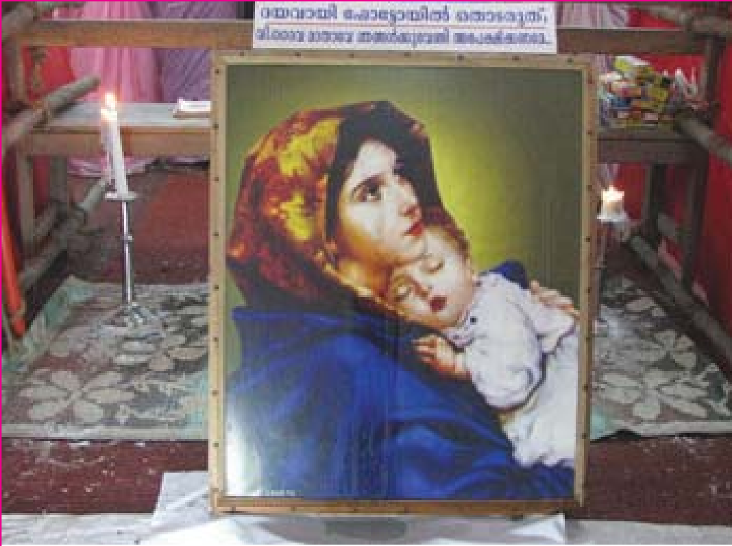
കായംകുളം: കട്ടച്ചിറ സെന്റ് മേരീസ് പള്ളിയിൽ വി. ദൈവമാതാവ് ഉണ്ണിയേശുവിനെ വഹിച്ചുകൊണ്ട് നിൽക്കുന്ന ഫോട്ടോയിൽ നിന്നും ജലം ഒഴുകുന്നു.

കായംകുളം: സെന്റ് മേരീസ് യാക്കോബായ സുറിയാനി പള്ളിയുടെ കീഴിലുള്ള സെന്റ് മേരീസ് ചാപ്പലിൽ സ്ഥാപിച്ചിരിക്കുന്ന ഫ്ളക്സിൽ മുദ്രണം നിർവ്വഹിക്കപ്പെട്ടിരിക്കുന്ന വി. ദൈവമാതാവിന്റെ ചിത്രത്തിലെ കണ്ണുകളിൽനിന്ന് അത്യന്തമൃതം