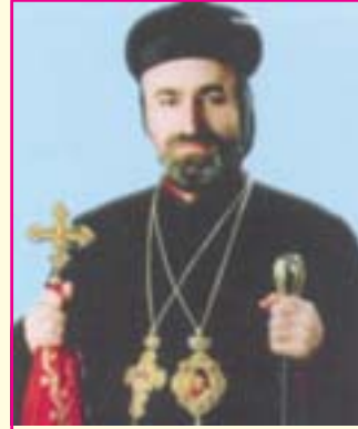
അഭി. ഹസൈൽ ശ്യാമി മോർ സേവേറിയോസ് നവംബർ 15