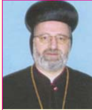
അഭി. സജിബാ ശ്മുൻ മോർ ഫിലക്സിനോസ് നവംബർ 1