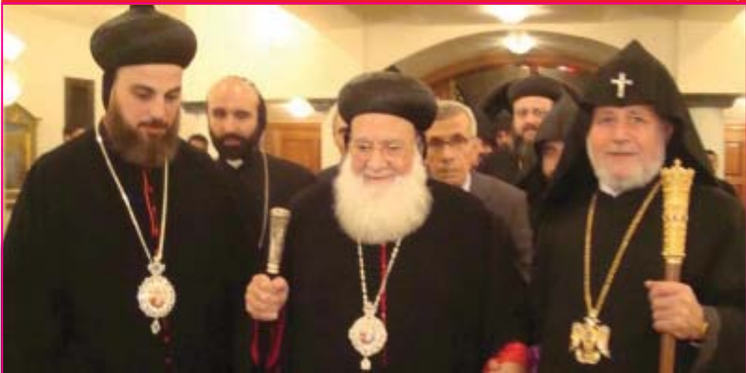
പരി. ഇഗ്നാത്തിയോസ് സഖാ പ്രഥമൻ പാത്രിയർക്കീസ് ബാവായെ അർമ്മേനിയൻ ഓർത്തഡോക്സ് സഭയുടെ കാതോലിക്കാ ബാവായോടൊപ്പം

ആകമാന സുറിയാനി സഭയുടെ പരമാദ്ധ്യക്ഷൻ പരി. ഇഗ്നാത്തിയോസ് സഖാ പ്രഥമൻ പാത്രിയർക്കീസ് ബാവായെ അർമ്മേനിയൻ ഓർത്തഡോക്സ് സഭയുടെ പരി. ആരാം പ്രഥമൻ കാതോലിക്കാ ബാവായും, മെത്രാപ്പോലീത്താമാരും സഭാ പ്രതിനിധികളും അടങ്ങുന്ന സംഘം സന്ദർശിച്ച് ചർച്ചകൾ നടത്തി. അർമ്മേനിയൻ സംഘത്തിനും തനിക്കും നൽകിയ സ്നേഹബഹുമാനാദരവുകൾക്ക് പരി. ആരാം പ്രഥമൻ കാതോലിക്കോസ് നന്ദി പ്രകാശിപ്പിച്ചു. അഖില ലോകസഭാ കൗൺസിലിന്റെ പ്രസിഡന്റ് ആയിരുന്നു, ലോകസഭകളെ നയിച്ച പരി.