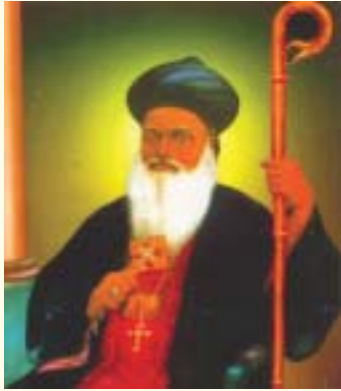
പാലുസ് മോർ അത്തനാസിയോസ് (കടവിൽ തിരുമേനി) നവംബർ 2