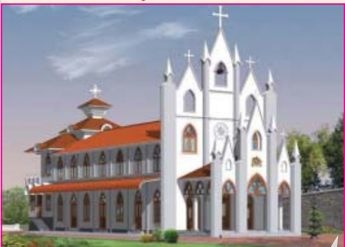
പുതുക്കിപ്പണിയുന്ന പള്ളിയുടെ രൂപരേഖ