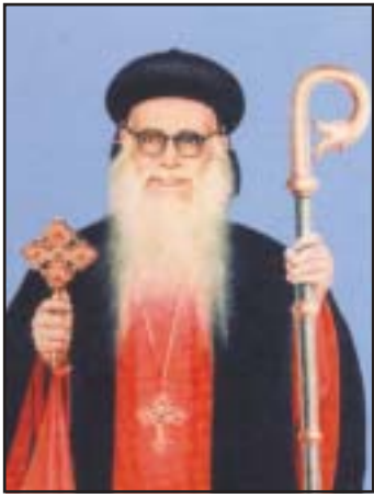
കടവിൽ ഡോ. പൗലോസ് മോർ അത്താനാസ്യോസ് (മാർച്ച് 7)