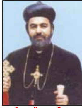
മോർ സ്മെത്തന്തിയോസ് മത്താ റോഹോ മാർച്ച് 16 ആർച്ച് ബിഷപ്പ് ജസീറിയ യൂക്രൈൻ