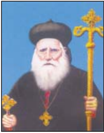
പരിശുദ്ധ സ്ത്രീബാ മോർ സെന്താത്തിയോസ് (മാർച്ച് 19)