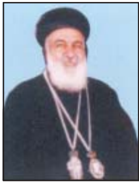
മോർ തിയോഫിലോസ് ജോർജ് സലീബ മാർച്ച് 31 ആർച്ച് ബിഷപ്പ് ലെബനോൻ