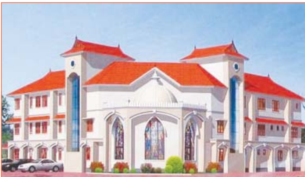
യാക്കോബായ സഭ കോട്ടയം ഭദ്രാസനം കണ്ടതിക്കുഴിയിടുത്തുള്ള ഇറഞ്ഞാലിൽ പുതുതായി നിർമ്മിക്കുന്ന ആസ്ഥാനമന്ദിരത്തിന്റെ രൂപരേഖ