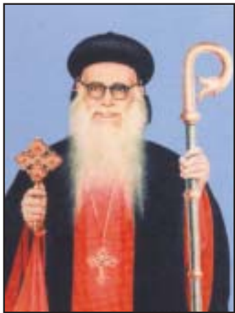
കോട്ടയം ഇടവകയുടെ പ്രഥമ മെത്രാപ്പോലീത്ത ആയി 1876-ൽ പ. പത്രോസ് പ്രാതിയർക്കീസ്ബാവായാൽ വാഴിക്ക