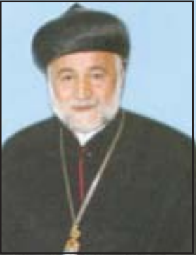
മോർ യൂലിയോസ് അബദ്യൂൾ ആഹാദ് ഷാബോ മാർച്ച് 8 ആർച്ച് ബിഷപ്പ് സ്വീഡൻ