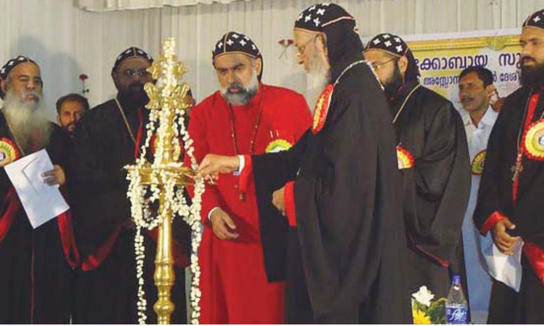
യൂത്ത് അസോസിയേഷൻ അഖില മലങ്കര ക്യാമ്പ് തുരുത്തിപ്പി വിശുദ്ധ മർത്തമറിയം യാക്കോബായ സുറിയാനി പള്ളിയിൽ ശ്രേഷ്ഠ കാതോലിക്കാ ബസേലിയോസ് തോമസ് പ്രഥമൻ ബാവ ഉദ്ഘാടനം ചെയ്യുന്നു.

പരിസ്ഥിതി സംരക്ഷണത്തിനായി യുവജനങ്ങളുടെ കർമ്മശേഷി വിനിയോഗിക്കണമെന്ന് ശ്രേഷ്ഠ കാതോലിക്കാ ബസേലിയോസ് തോമസ് പ്രഥമൻ ബാവ പറഞ്ഞു. ആലുവയിലെ മഹാപരിശുദ്ധനായ വലിയ തിരുമേനിയുടെ പൗരോഹിത്യ ശതാബ്ദിയോടനുബന്ധിച്ച് ഒരു ലക്ഷം വ്യക്തകൾ നടുവാനുള്ള സഭയുടെ ശ്രമത്തിൽ യുവജനങ്ങളുടെ സജീവ പങ്കാളിത്തം ഉണ്ടാകണമെന്ന് ബാവ വ്യക്തിമാക്കി