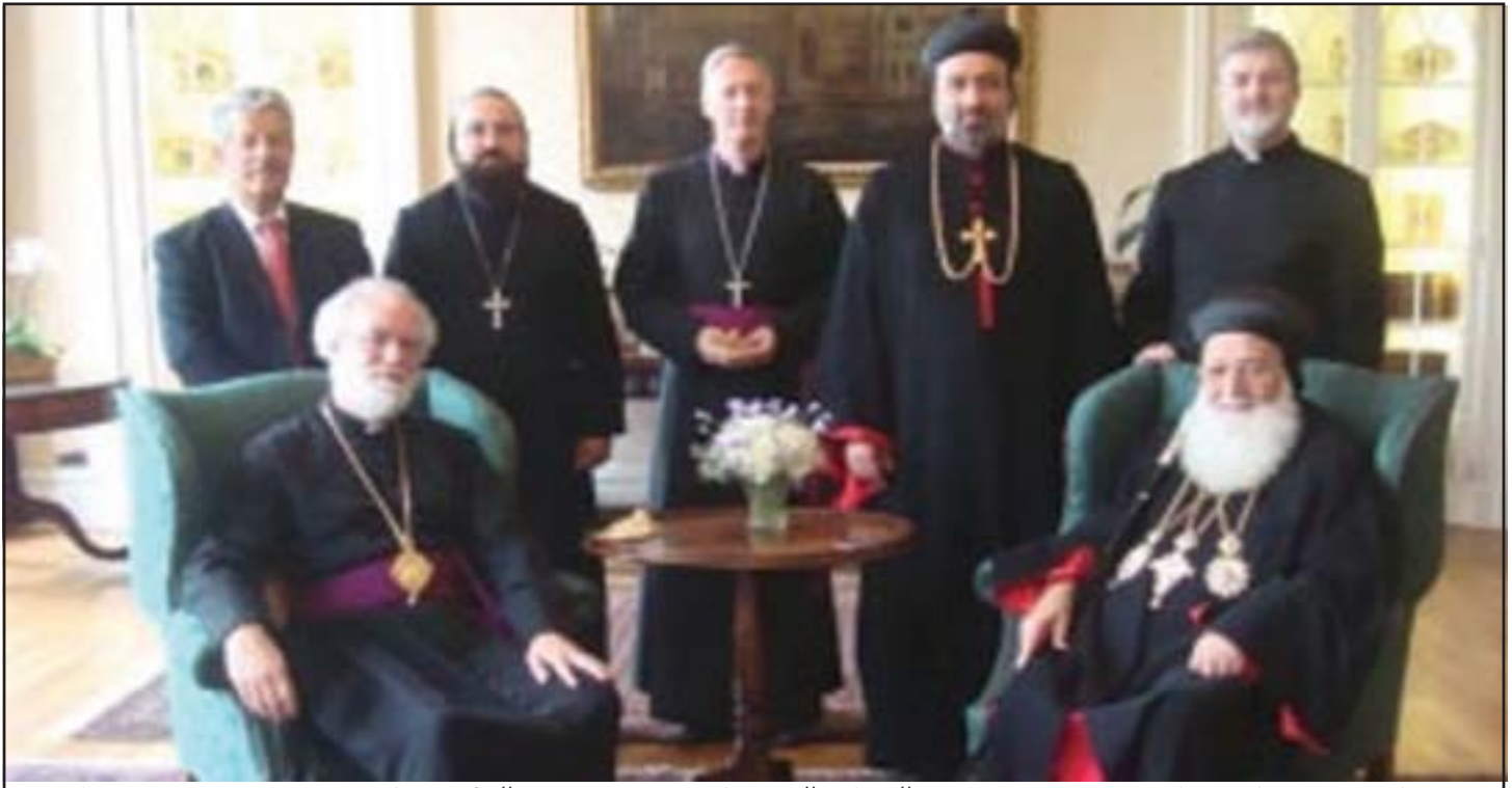
പരിശുദ്ധ സഖാ പ്രഥമൻ പാത്രിയർക്കീസ് ബാവ കാൻറബറി ആർച്ച് ബിഷപ്പ് റവ. ഡോ. റോവാൻ വില്യംസിനെ സന്ദർശിച്ചപ്പോൾ.

മലങ്കര സഭയിലെ കലഹം തീർക്കുവാൻ 1876-ൽ പരിശുദ്ധ പത്രോസ് തൃതീയൻ പാത്രിയർക്കീസ് ബാവ ലണ്ടൻ സന്ദർശിച്ചു. ഇതിനെക്കുറിച്ച് 1995-ൽ കാൻറബറി ആർച്ച് ബിഷപ്പ് ജോർജ്ജ്കാരി കേരളം സന്ദർശിച്ചപ്പോൾ മലയാള മനോരമ നടത്തിയ അഭിമുഖത്തിൽ പരിശുദ്ധ പത്രോസ് തൃതീയൻ പാത്രിയർക്കീസ് ബാവായെക്കുറിച്ച് ഇങ്ങനെ പറയുകയുണ്ടായി. ഓർത്തഡോക്സ് സഭയുമായുള്ള ബന്ധങ്ങൾ എങ്ങനെയാണ്? എന്ന മനോരമ ലേഖകന്റെ ചോദ്യത്തിന് ആർച്ച് ബിഷപ്പ് മറുപടി പറഞ്ഞതിങ്ങനെയാണ് സി.എം.എസ്. മിഷനറിമാരുടെ കാലത്ത്, കഴിഞ്ഞ നൂറ്റാണ്ടിന്റെ മധ്യത്തിൽ സിറിയൻ ഓർത്തഡോക്സ് സഭയുടെ പാത്രിയർക്കീസ് പീറ്റർ തൃതീയന്റെ കാൻറബറി ആർച്ച് ബിഷപ്പ് ആർച്ച് ബിഷപ്പ് റെൻഡിന്റെ ആതിഥ്യം സ്വീകരിച്ചു രണ്ടു വട്ടം ലണ്ടൻ സന്ദർശിച്ചു. അദ്ദേഹത്തിന്റെ ഛായാചിത്രം