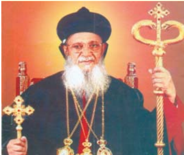
ശ്രേഷ്ഠ കാതോലിക്ക ബസേലിയോസ് തോമസ് പ്രഥമൻ ബാവ