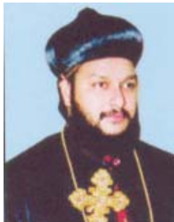
അഭി. തീത്തോസ് മോർ യൽദോ