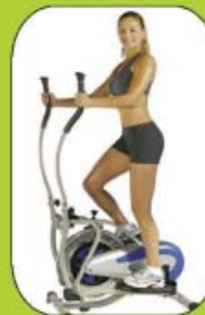
FULL BODY EXCERCISE By Techno Bike