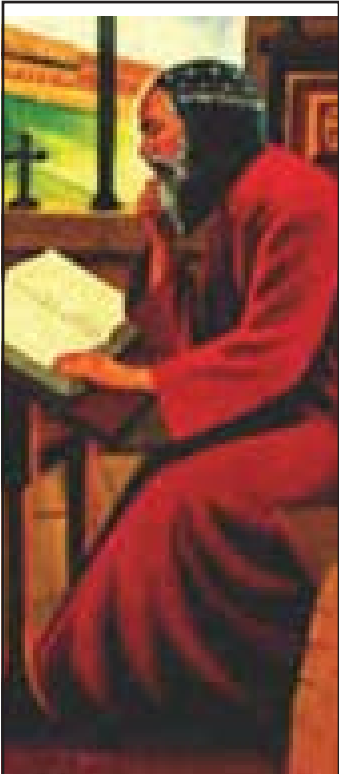
മാർ ഗ്രിഗോറിയോസ് ബാർ എബ്രായ ജൂലൈ 30