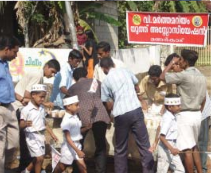
ജെ. എസ്. വി. ബി. എസ് സമാപന റാലിയിൽ പങ്കെടുത്ത കുട്ടികൾക്ക് യുത്ത് അസോസിയേഷൻ പ്രവർത്തകർ ശീതളപാനീയം നൽകുന്നു