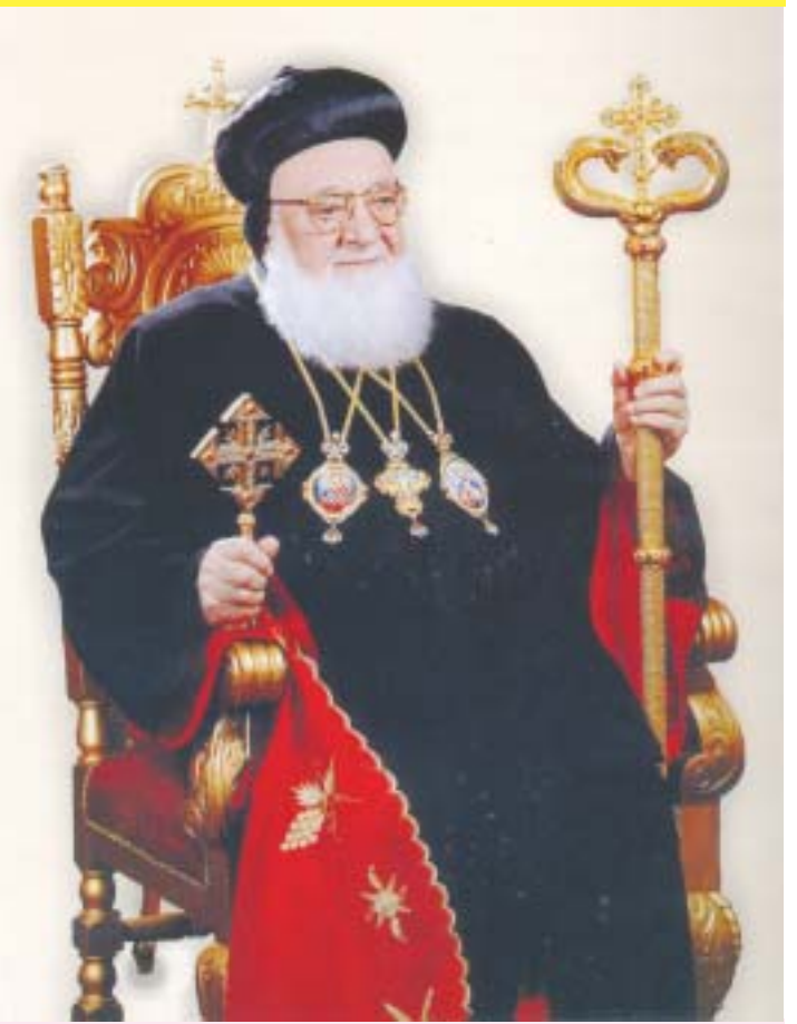
ഏപ്രിൽ 21-ന് 76-ാമത് ജന്മദിനം ആഘോഷിച്ച ആകമാന സുറിയാനി സഭയുടെ പരമാദ്ധ്യക്ഷൻ മോറാൻ മോർ ഇഗ്നാത്തിയോസ് സക്കാ ഐവാസ് പ്രഥമൻ പാത്രിയർക്കീസ് ബാവായ്ക്ക് യുത്ത് അസോസിയേഷൻ മണർകാട് യൂണിറ്റിന്റെ പ്രാർത്ഥനാപൂർവ്വമായ ആശംസകൾ