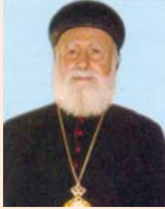
മോർ സേവേറിയോസ് ജമിൽഹവാ ഏപ്രിൽ 14 ആർച്ച് ബിഷപ്പ് ഓഫ് ബാഗ്ദാദ് & ബാർസ