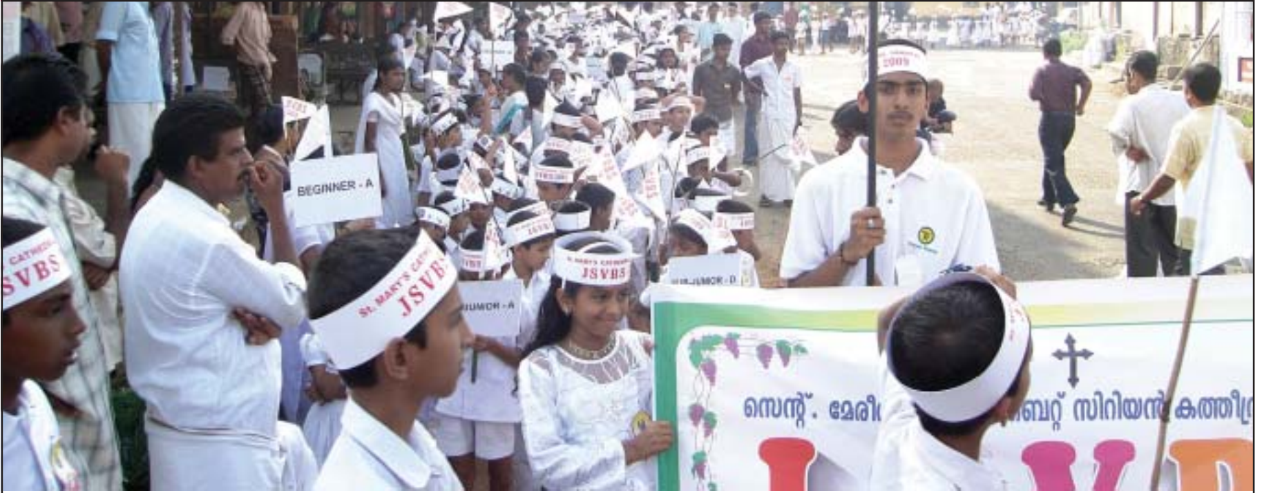
ജെ. എസ്. വി. ബി. എസ്. സമാപന റാലി മണർകാട് കവലയിൽ എത്തിച്ചേർന്നപ്പോൾ

മണർകാട്: വിശുദ്ധ മർത്തമറിയം കത്തീഡ്രലിന്റെ കീഴിൽ പ്രവർത്തിക്കുന്ന 16 സഭാസമിതികളുടെ ആഭിമുഖ്യത്തിൽ ആണ്ടുതോറും നടത്തിവരുന്ന ജെ. എസ്. വി.ബി.എസ്. ഏപ്രിൽ 13-ാം തീയതി ആരംഭിച്ചു, 25-ാം തീയതി വർണ്ണശബളമായ റാലിയോടുകൂടി സമാപിച്ചു. മുൻവർഷങ്ങളെ അപേക്ഷിച്ച് കൂടുതൽ കുട്ടികൾ വി. ബി. എസ്.-ൽ സംബന്ധിച്ചു.