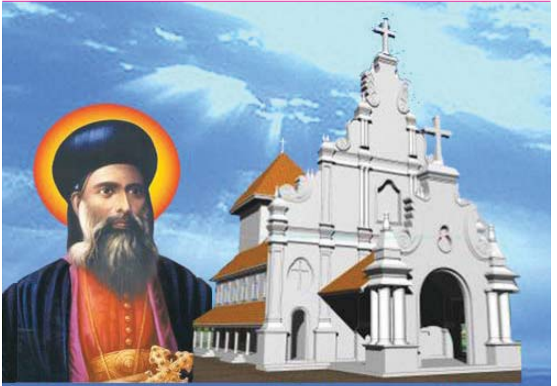
പരുമലയിൽ യാക്കോബായ സഭ നിർമ്മിക്കുന്ന മോർ ഗ്രീഗോറിയോസ് യാക്കോബായ സുറിയാനിപ്പള്ളിയുടെ രേഖാചിത്രം