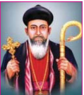
ദുഖ്‌റോനോ: ഒക്ടോബർ 22

മലങ്കരസഭയെ സത്യവിശ്വാസത്തിൽ നിലനിർത്തുന്നതിനും, പൗരോഹിത്യ ന്യൂനതകൾ പരിഹരിക്കുന്നതിനുമായി പ്രതിസന്ധികളെ അതിജീവിച്ച്, കഷ്ടതകളും, നഷ്ടങ്ങളും, യാത്രാക്ലേശങ്ങളും സഹിച്ച് കാലാകാലങ്ങളിൽ പരിശുദ്ധ അന്ത്യോഖ്യാ സിംഹാസനത്തിൽനിന്നും പ. പിതാക്കന്മാർ മലങ്കരയിൽ വരികയും ഈ മണ്ണിൽ കബറടങ്ങുകയും ചെയ്തിട്ടുണ്ട്. വി. അന്ത്യോഖ്യായുടെ അപ്പസ്തോലിക സിംഹാസനത്തിൽ വാണരുളിയ പ. ഇഗ്നാത്തിയോസ് ഗീവർഗീസ് മൂന്നാമൻ ബാവയാൽ മലങ്കരയിലേക്ക് നിയോഗിച്ച പ. പിതാവാണ് മോർ ശക്രള ബാവ.