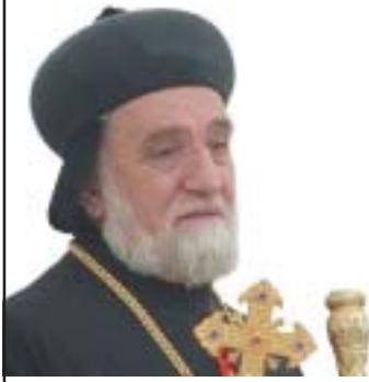
അഭിവന്ദ്യ മോർ യൂലിയോസ് യേശു ശിശക് ഒക്ടോബർ 29