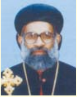
അഭിവന്ദ്യ ഗീവനൂസിസ് മോർ അത്താനാസിയോസ് ഒക്ടോബർ 12