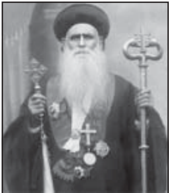
പ.ഇഗ്നാത്തിയോസ് അബ്ദദോഹോ പാത്രിയർക്കീസ് ബാവ