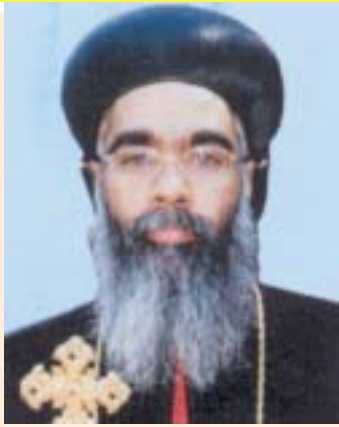
അഭിവന്ദ്യ കുറിയാക്കോസ് മോർ ദിയസ്കോറോസ് മെയ് 11