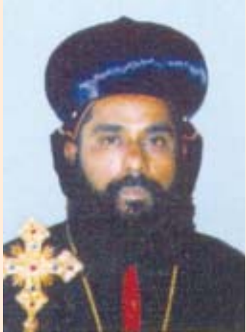
അഭിവന്ദ്യ മാത്യസ് മോർ തേവോദോസിയോസ് മെയ് 4