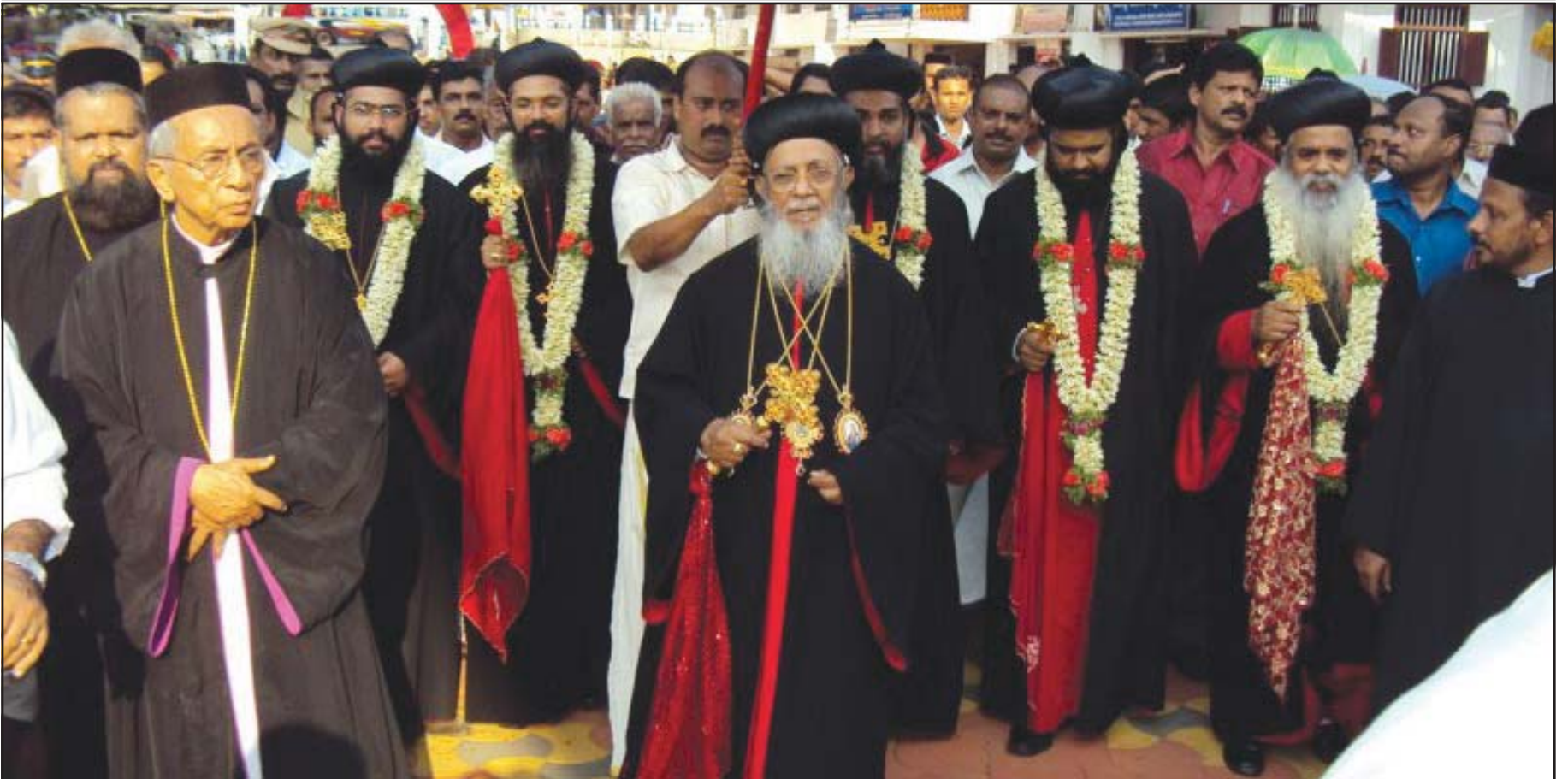
മണർകാട് പള്ളിയിലേക്ക് ശ്രേഷ്ഠബാവായേയും അഭിവന്ദ്യ പിതാക്കന്മാരേയും സ്വീകരിച്ച് ആനയിക്കുന്നു