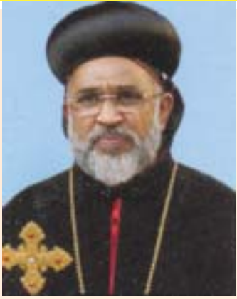
അഭിവന്ദ്യ തോമസ് മോർ തീമോത്തിയോസ് മെയ് 2