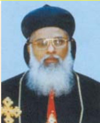
അഭിവന്ദ്യ ഗീവർഗീസ് മോർ ദീവനാസിയോസ് മെയ് 5