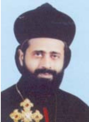
അഭിവന്ദ്യ കുറിയാക്കോസ് മോർ സേവേറിയോസ് മെയ് 21