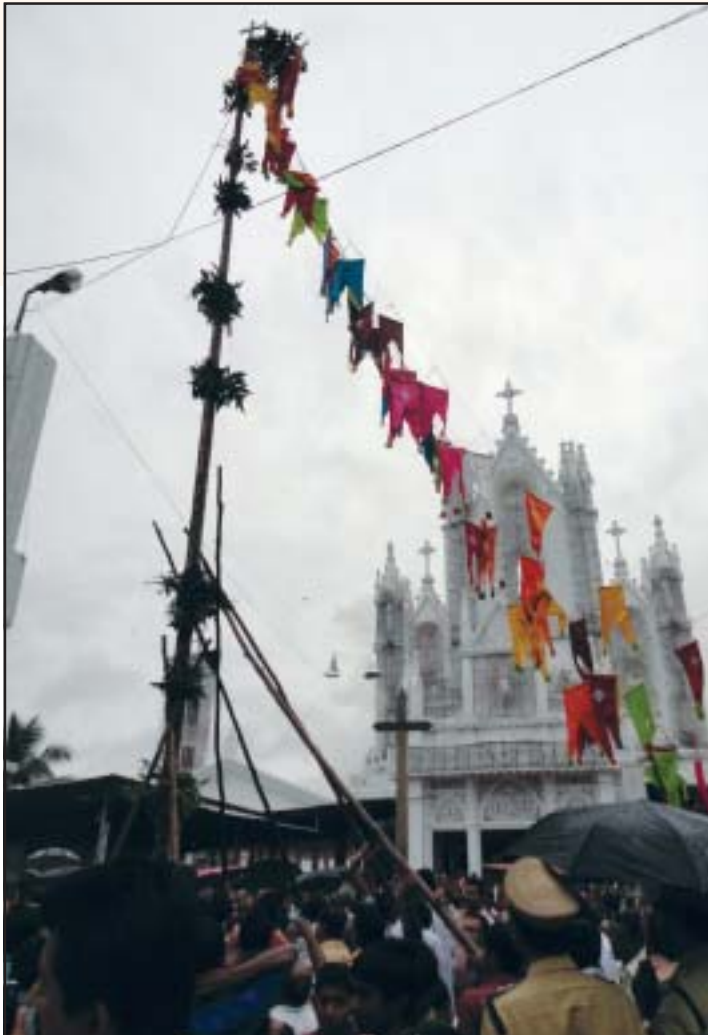
പെരുന്നാളിന് തുടക്കം കുറിച്ചുകൊണ്ട് കൊടിമരം ഉയർത്തുന്നു

ജീവിതത്തിലും പകർത്തുവാൻ കഴിയുമ്പോൾ ആണ് അനുഗ്രഹങ്ങളാകുന്ന വരദാനങ്ങൾ നമുക്ക് സ്വായത്തമാക്കുവാൻ കഴിയുന്നത്. ജാതിമത വ്യത്യാസം കൂടാതെ ജനലക്ഷങ്ങൾ ഈ നോമ്പാചരണത്തിലൂടെ ജീവിതശൈലിയിൽ മാറ്റം വരുത്തുന്നു എന്നത് ശ്രദ്ധേയമാണ്. നോമ്പാചരണം മനുഷ്യനെ വിനീതനും കരുണാപൂർണ്ണനുംമാക്കുന്നു. മാനസികമായും ശാരീരികമായും മനുഷ്യൻ ശക്തീകരിക്കപ്പെടുന്നു. അപരനെ സ്നേഹിക്കുവാൻ പരിശീലിക്കുന്നു. ക്ഷമാശീലനും, സന്തോഷവാനുമായി മനുഷ്യൻ മാറുന്നു. ജഡത്തിന്റെ ആസക്തികളെ നിയന്ത്രിച്ച് ഏകാഗ്രതയോടെ ദൈവത്തെ സ്തുതിക്കുവാനും മനുഷ്യനും ദൈവവുമായുള്ള ബന്ധം പുനസ്ഥാപിക്കുവാനും നോമ്പാചരണത്തിലൂടെ നമുക്ക് സാധിക്കുന്നു. ആത്മവിനെ ശുദ്ധീകരിക്കാനും ആത്മപരിധാന നടത്തുവാനുമുള്ള മാർഗ്ഗമായി നോമ്പാചരണവും പെരുന്നാളുകളും മാറുമ്പോഴാണ് അത് മനുഷ്യന് ആത്മസംതുപ്തി നൽകുന്നത്. നാം വ്യക്തിജീവിതത്തിലേക്കും ഉത്തരവാദിത്വങ്ങളിലേക്കും തിരിഞ്ഞു നോക്കി പിഴവുകൾ തിരുക്കുക. പുതുകെ പ്രാപിച്ചവരായി നാം മാറുക. പരിശുദ്ധ അമ്മയുടെ ജനപ്പെരുന്നാൾ നമ്മിൽ പ്രകാശം പരത്തുന്നതും നിർമ്മലീകരിക്കുന്നതും അഹങ്കാരം വെടിഞ്ഞ് വിനീതരാകുന്നതും പ്രാർത്ഥനാ നിരതരാകുന്നതുമായി തീരണം. ഈ വർഷത്തേ നോമ്പാചരണവും പെരുന്നാളും അനേകായിരങ്ങൾക്കു ശാന്തിയും ദൈവത്തിന്റെ കൃപാ വരങ്ങളും പ്രധാനം ചെയ്യുന്നതായി തീരട്ടെ എന്നു പ്രാർത്ഥിക്കുന്നു. ആശ്രിതഗ്രന്ഥങ്ങൾ: ഇതാനിന്റെ അമ്മ-ഡോ. ജോസഫ് കോട്ടയ്ക്കൽ 2) ദൈവികാനുഗ്രഹത്തിനുള്ള കൃപാ വരങ്ങൾ : പോളിക്കാർപ്പസ് ഗീവറുഗീസ് മെത്രാപ്പോലീത്ത.