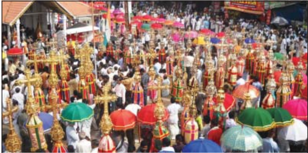
റാസാ മണർകാട് കവലയിലുള്ള കുരിശിൻതൊട്ടിയിലെത്തിയപ്പോൾ