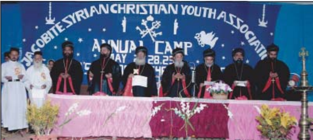
2005-ൽ യൂത്ത് അസോസിയേഷന്റെ അഖില മലങ്കര ക്യാമ്പ് മണർകാട് പള്ളിയിൽവെച്ച് നടത്തിയ പ്ലോൾ ശ്രേഷ്ഠ കാതോലിക്കാ ബാവായോടും അഭിവന്ദ്യ മെത്രാപ്പോലീത്തന്മാരോടുമൊപ്പം അഭി. മോർ പോളിക്കാർപ്പസ് തിരുമേനി