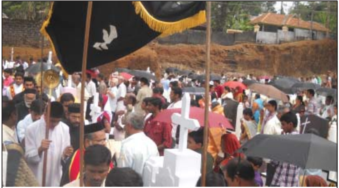
ആനിദേ ഞായറാഴ്ച ശവക്കോട്ടച്ചുറ്റിയുള്ള പ്രദീക്ഷണത്തിൽനിന്നും...