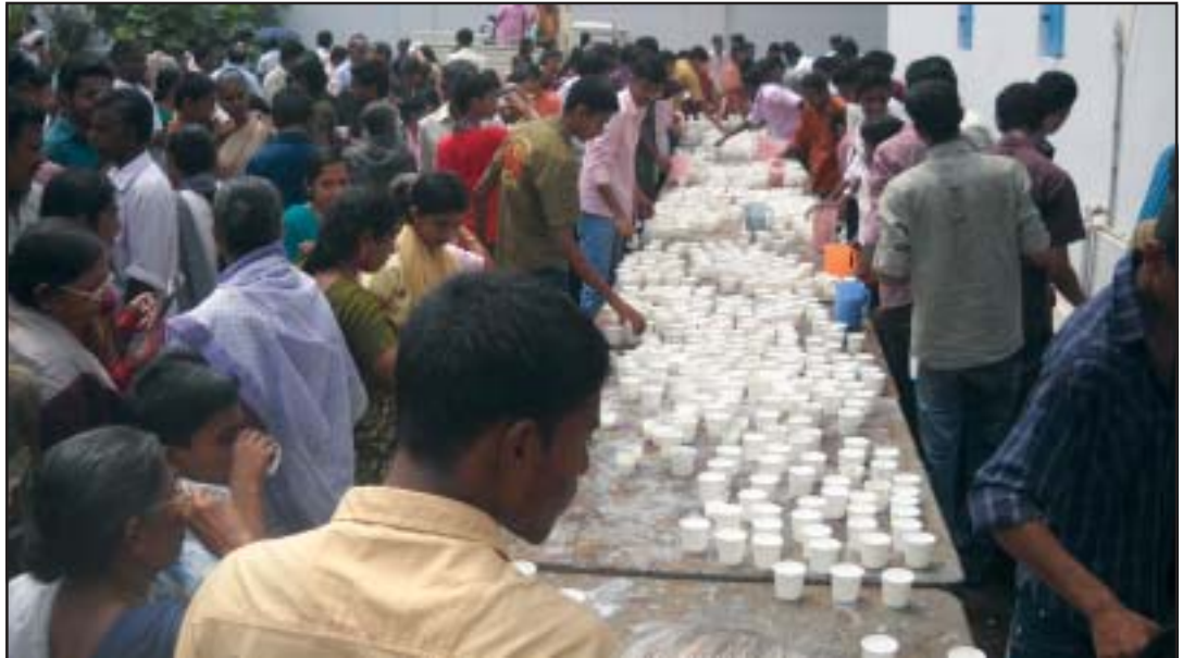
ആനിദേ ഞായറാഴ്ച യൂത്ത് അസോസിയേഷന്റെ ആഭിമുഖ്യത്തിൽ ഭക്തജനങ്ങൾക്ക് സംഭാരം വിതരണം ചെയ്യുന്നു.

ദീർഘമായ 10 വർഷങ്ങൾ പല വിധത്തിലുള്ള മാനസിക പീഡകൾക്ക് വിധേയമായി താൻ ജീവിച്ചു. നിരാശയിലും നിരർത്ഥകമായ ജീവിതത്തിലും മുന്പോട്ട് പോയപ്പോൾ അദ്ദേഹം എന്തു ചെയ്തു എന്ന് തുടർന്ന് വിവരിക്കുന്നു. ഞാൻ ക്രിസ്തുവിന്റെ ജീവിതത്തിലേക്ക് എന്നെതന്നെ ആമഗ്നമാക്കി. ഞാൻ അവന്റെ ക്രൂശിൽനിന്ന് ശക്തിയും അർത്ഥവും ആശ്വാസവും പ്രാപിച്ചു. (I plunged into the life of Christ and I found strength meaning and consolation in the cross of Christ). അങ്ങനെയാണ് തന്റെ ഏറ്റവും വിശിഷ്ടമായ ക്രിസ്തുവിന്റെ ജീവിതം എന്ന ഗ്രന്ഥം എഴുതുന്നതിന് കഴിഞ്ഞത് എന്നദ്ദേഹം പറയുന്നു. ഏറ്റവും അന്ധകാരമായ ജീവിത സാഹചര്യങ്ങളിൽ നമുക്ക് ക്രൂശിൽനിന്ന് ലഭിക്കുന്ന ദിവ്യ പ്രകാശത്തിലൂടെയാണ് യേശുക്രിസ്തുവിന്റെ കുരിശ് നമ്മുടെ ജീവിതത്തിനും അർത്ഥമുള്ളതായിത്തീരുന്നത്.