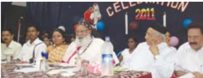
സെന്റ് മേരീസ് കോളേജിന്റെ ക്രിസ്തീയ ആഘോഷം അഭിലിപ്പോസ് മോർ ക്രിസോസ്റ്റം മെത്രാപ്പോലീത്താ ഉദ്ഘാടനം ചെയ്യുന്നു.