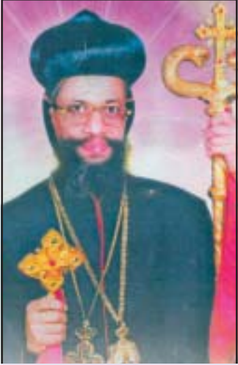
അഭി. ബെന്യാമിൻ ജോസഫ് മോർ സെന്താത്തിയോസ് മെത്രാപ്പോലീത്ത ജൂൺ 17