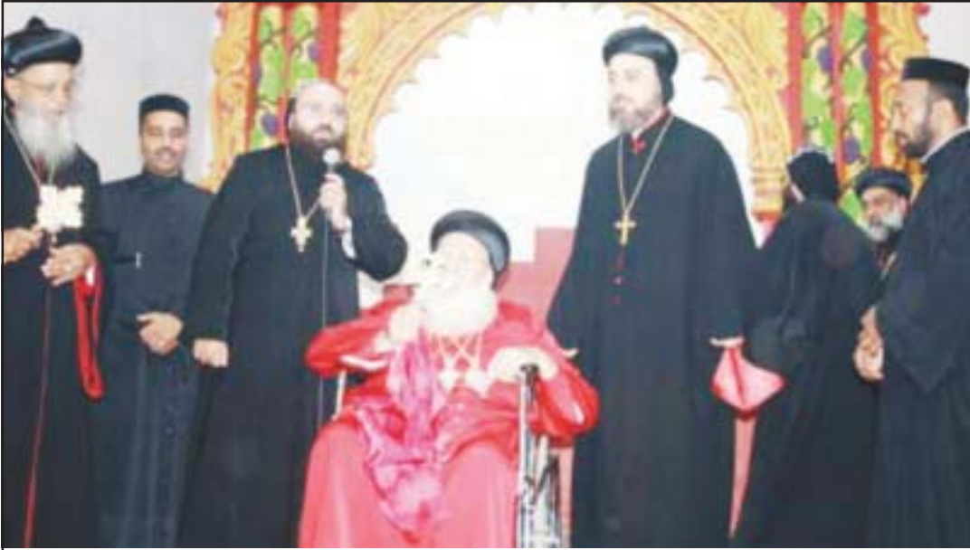
റാസൽഖൈമയിലെ മാർ ഗ്രീഗോറിയോസ് പള്ളിയുടെ കുദാശ പരിശുദ്ധ പാത്രിയർക്കീസ് ബാവാ തിരുമനസ്സുകൊണ്ട് നിർവ്വഹിക്കുന്നു. ശ്രേഷ്ഠ കാതോലിക്കാ ബസേലിയോസ് തോമസ് പ്രഥമൻ ബാവായും മെത്രാപ്പോലീത്തന്മാരും സമീപം