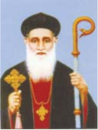
പരിശുദ്ധ മോർ ഗ്രിഗോറിയോസ് അബദ്യൾ ജലിൽ വടക്കൻ പറവൂർ