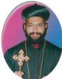
അഭി. പൗലോസ് മാർ ഐനേനിയോസ്