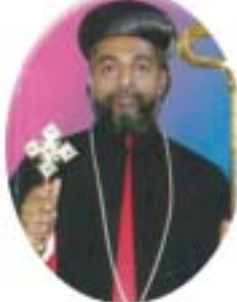
അഭി. സക്കറിയാസ് മാർ ഫീലക്സിനോസ്