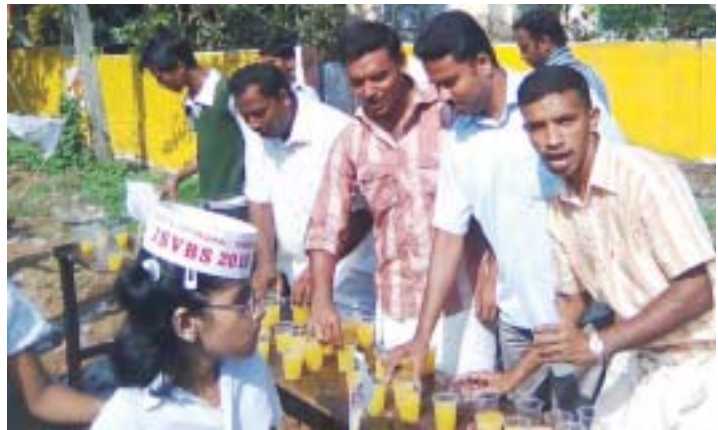
യുത്ത് അസോസിയേഷൻ പ്രവർത്തകർ ജെ. എസ്. വി. ബി. എസ് റാലിയിൽ പങ്കെടുത്ത കുട്ടികൾക്ക് ശീതളപാനീയം നൽകുന്നു.