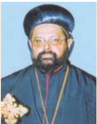
മോർ ഇവാനിയോസ് മാത്യൂസ് ഏപ്രിൽ 29 കണ്ടനാട് ഭദ്രാസന മെത്രാപ്പോലീത്ത