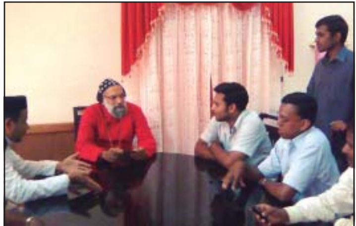
യുത്ത് അസോസിയേഷൻ പ്രവർത്തകർ അഭി. ഗീവർഗീസ് മോർ അത്താനാസിയോസ് തിരുമേനിയുമായി നടത്തിയ അഭിമുഖത്തിന്റെ ദൃശ്യം