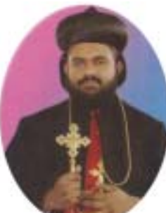
അഭി. ഐസക് മാർ സെന്താത്തിയോസ്