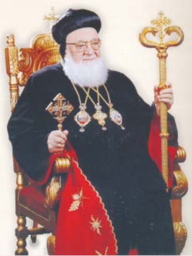
ഏപ്രിൽ 21-ന് 77-ാം ജന്മദിനം ആഘോഷിച്ച ആകമാന സുറിയാനി സഭയുടെ പരമാദ്ധ്യക്ഷൻ മോറൻ മോർ ഇഗ്നാത്തിയോസ് സക്കാ ഐവാസ് പ്രഥമൻ പാത്രിയർക്കീസ് ബാവായ്ക്ക് യുത്ത് അസോസിയേഷൻ മണർകാട് യൂണിറ്റിന്റെ പ്രാർത്ഥനാപൂർവ്വമായ ആശംസകൾ