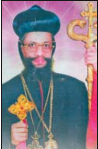
അഭി. വെന്നാചിൻ മാർ സെന്താത്തിയോസ് ജൂൺ 17