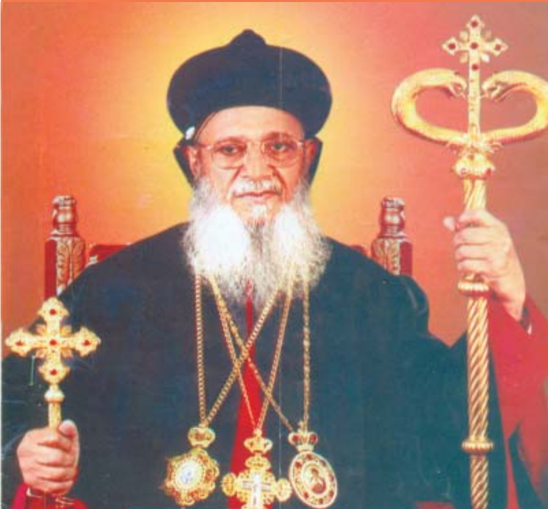
ശ്രേഷ്ഠ ബാവായ്ക്ക് കോലോസുറിയോയുടെ ആശംസകൾ

മലങ്കര യാക്കോബായ സുറിയാനിസഭയുടെ ശ്രേഷ്ഠ കാതോലിക്കായായി വാഴിക്കപ്പെട്ടതിന്റെ ആറാം വാർഷികത്തോടൊപ്പം ജൂലൈ 22-ന് ബാവ എൺപതാം വയസ്സിലേക്ക് പ്രവേശിച്ചു. തന്റെ ആടുകളുടെ ശബ്ദം തിരിച്ചറിഞ്ഞ്, തന്റെ ജീവൻവരെ കൊടുക്കുവാൻ തയ്യാറായി വിശ്വാസ സമൂഹത്തിന് ആത്മീയ ദീപ്തിയും അനുഗ്രഹങ്ങളും പകർന്നാണ് ശ്രേഷ്ഠ ബാവ എൺപതാം വയസ്സിലേക്ക് പ്രവേശിക്കുന്നത്. നാട്യങ്ങളില്ലാത്ത പെരുമാറ്റത്തിലൂടെ തന്നോട് ഇടപെടുന്ന ആരുടെയും സ്നേഹബഹുമാനങ്ങൾ നേടുന്നതിൽ ബാവ മലങ്കരയിലെ മറ്റ് സഭാപിതാക്കന്മാർക്ക് മാതൃകയാണ്. പിതൃസഹജമായ സ്നേഹവാൽസ്യങ്ങളുടെ മാധുര്യത്തോടെ ശ്രേഷ്ഠപിതാവ് മലങ്കര സഭയിലെ മക്കളുടെ മനസ്സിലേക്ക് ആഴ്ന്നിറങ്ങുന്നു. എളിമയിലൂടെയും കരുണയും ആർദ്രതയും നിറഞ്ഞവാക്കുകളിലൂടെയും ബാവ