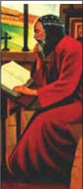
മോർ ഗ്രിഗോറിയോസ് ബാർ എബ്രായ ജൂലൈ 30