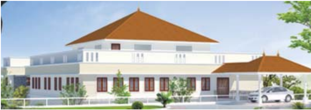
മുഖ്യമന്ത്രി ഉമ്മൻചാണ്ടി ഉദ്ഘാടനം നിർവ്വഹിക്കുന്ന മണർകാട് സെന്റ് മേരീസ് കോളജിലെ വിമൻസ് ഹോസ്റ്റൽ

യു. ജി. സി. ധനസഹായത്തോടെ മണർകാട് സെന്റ് മേരീസ് കോളജിൽ പണി പൂർത്തിയാക്കിയ വനിതാ ഹോസ്റ്റൽ ബഹു. കേരള മുഖ്യമന്ത്രി ശ്രീ.ഉമ്മൻ ചാണ്ടി സെപ്തംബർ 4 ഞായറാഴ്ച നിർവ്വഹിക്കും. ഏതാണ്ട് സമചതുരാകൃതിയിൽ 9200 ചതുരശ്ര അടി വിസ്തൃതിയിൽ മൂന്നു നിലകളായിട്ടാണ് ഹോസ്റ്റൽ സമുച്ചയത്തിന്റെ രൂപകല്പന. ഒന്നും രണ്ടും നിലകളിൽ