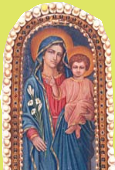
വിശുദ്ധ ദൈവമാതാവേ ഞങ്ങൾക്കുവേണ്ടി അപേക്ഷിക്കണമേ

ആരംഭിക്കുന്നതാണ്. ഇതോടനുബന്ധിച്ച് അദ്ധ്യാപകർക്കുള്ള ബൈബിൾ കിസ് മത്സരവും ക്രമീകരിച്ചിട്ടുണ്ട്. കൂടുതൽ പോയിന്റ് നേടുന്ന സഭാസെന്റുകൾക്കുള്ള ഉപഹാരങ്ങൾ മത്സരാനന്തരം വിതരണം ചെയ്യുന്നതാണ്.