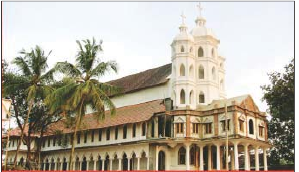
പണിപൂർത്തീകരിക്കുന്ന മലേക്കൂരിൽ ദയറാ

മലങ്കരയുടെ പ്രകാശ ഗോപുരമായി ദീർഘവർഷക്കാലം പരി. അന്ത്യോഖ്യാസിംഹാസനത്തിന്റെ കീഴിൽ മലങ്കര യാക്കോബായ സുറിയാനി സഭയെ മേയ്ച്ചു ഭരിച്ച ഭാഗ്യവാനായ മോർ ബസേലിയോസ് പൗലോസ് ദ്വിതീയൻ ബാവായുടെ ശ്രാദ്ധപ്പെരുന്നാൾ ഈ വർഷവും പൂർവ്വാധികം ഭംഗി