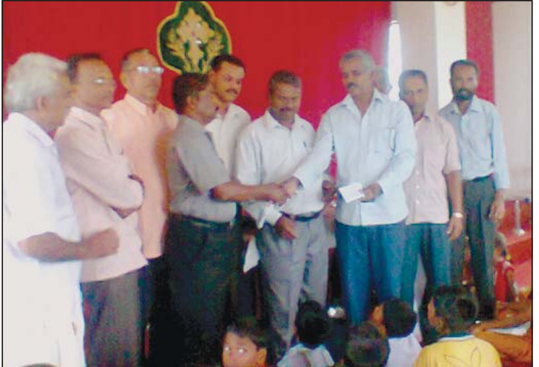
ബാംഗ്ലൂർ മേഖലയിലെ ജിഹണി, ഹള്ളുഹള്ളി മിഷനറി ഫീൽഡുകൾ സന്ദർശിച്ച മണർകാട് പള്ളി സെന്റ് പോൾസ് മിഷൻ അംഗങ്ങൾ ധനസഹായം കൈമാറുന്നു.