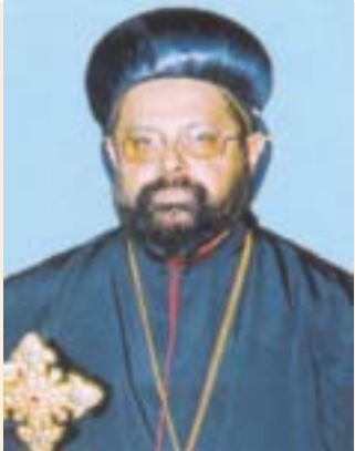
മോർ ഇവാനിയോസ് മാത്യൂസ് ഏപ്രിൽ 29 കണ്ടനാട് ഭദ്രാസനം മെത്രാപ്പോലീത്ത