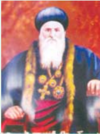
മോനാൻ മാർ ഇസ്രായീൽ യോസഫ് പത്രോസ് തൃതിയൻ കുർക്കുമ ദയന, ടർക്കി