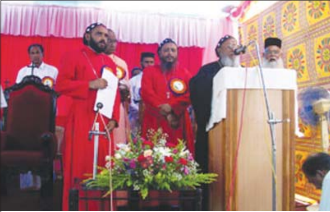
യാക്കോബായ സുറിയാനി സഭ ഇടുക്കി ഭദ്രാസനം നിലവിൽ വന്നതിന്റെ പ്രഖ്യാപനം ശ്രേഷ്ഠ കാതോലിക്കാ ബാവാ നിർവ്വഹിക്കുന്നു.