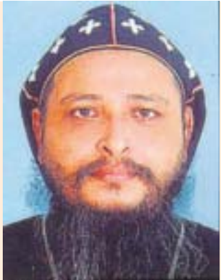
മോർ അന്താനാസിയോസ് ഏലിയാസ് ഏപ്രിൽ 13 അന്ത്യോഖ്യാ വിശ്വാസ സംരക്ഷണ സമിതി മെത്രാപ്പോലീത്ത