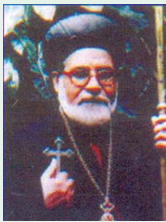
മാർ ക്രിസോസ്തോമോസ് മാശ സലാമ ബ്രസീൽ