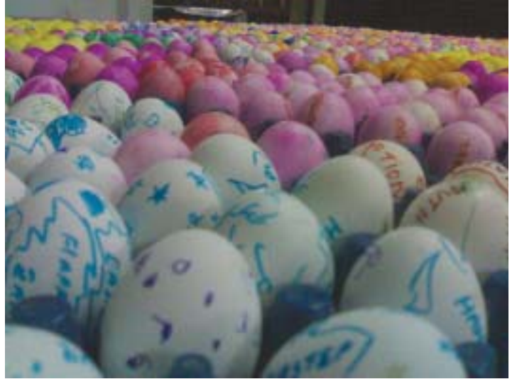
ഇസ്തർ മുട്ട ഒരു ദൃശ്യം: യൂത്ത് അസോസിയേഷന്റെ ആഭിമുഖ്യത്തിൽ ഉയിർപ്പ് പെരുന്നാളിൽ സംബന്ധിച്ച ഭക്തജനങ്ങൾക്ക് ഇസ്തർ മുട്ട വിതരണം ചെയ്തു.