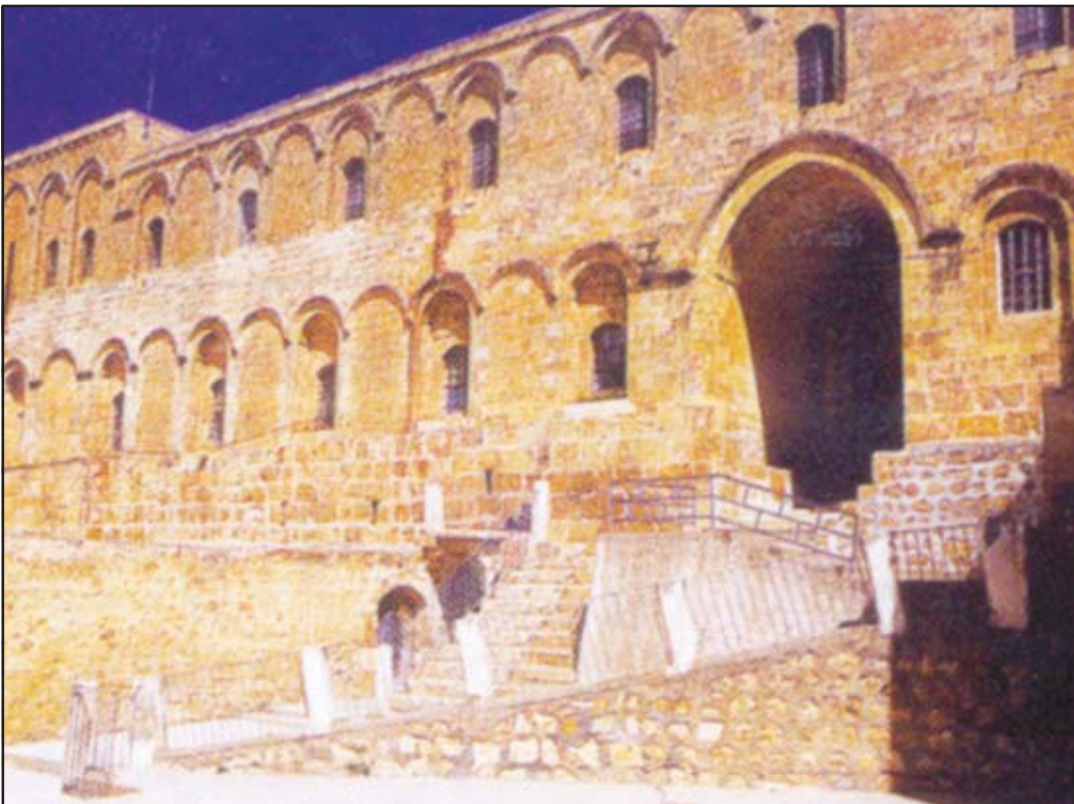
പരി. ഇഗ്നാത്തിയോസ് പത്രോസ് തൃതിയൻ പാത്രിയർക്കീസ് ബാവാ ഉൾപ്പെടെ അനേക പാത്രിയർക്കീസുമാർ കബറടങ്ങിയ പാത്രിയർക്കോ ആസ്ഥാനമായിരുന്ന ടർക്കിയിലെ പ്രസിദ്ധമായ കുർക്കുമ്മ ദേവാ