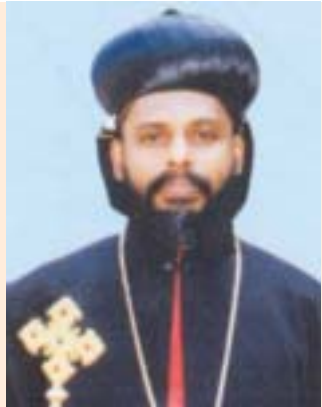
മോർ മിലിത്തിയോസ് യുഹാനോൻ ഏപ്രിൽ 25 കൊല്ലം, തുമ്പമൺ ഭദ്രാസനങ്ങളുടെ മെത്രാപ്പോലീത്ത