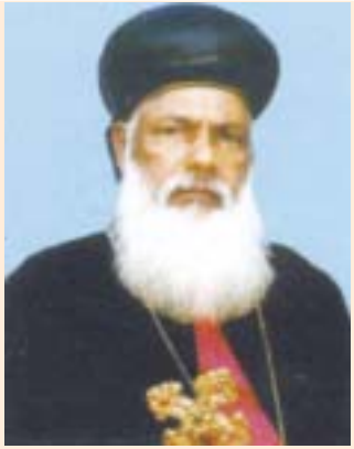
മോർ പാപ്പലിക്യാർപ്പസ് ഗീവർഗീസ് ഏപ്രിൽ 5 പൗരസ്ത്യസുവിശേഷ സമാജം മെത്രാപ്പോലീത്ത