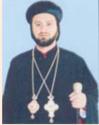
മോർ നിക്ക്കൊളാസ് മത്തി അബ് ആലാഹ് ഏപ്രിൽ 6 പാത്രിയാർക്കൽ വികാർ അർജന്റീന