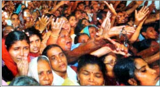
എട്ടുനോമ്പിനോടനുബന്ധിച്ച് മണർകാട് പള്ളിയിലെ നട തുറന്നപ്പോഴുള്ള ഭക്തജനത്തിരക്കി

മണർകാട്: ഭക്തജനസാഗരം സാക്ഷിയായി മണർകാട് പള്ളിയിലെ ചരിത്രപ്രസിദ്ധമായ നടതുറക്കൽ ചടങ്ങ് നടന്നു.